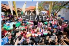
Conference of Youthの様子(2008)

公害の悪化が各国でみられ、国際的な問題に発展。環境問題が成長を阻害する要因としてクローズアップされる。環境保全のための多くの取り組みが世界各国で生まれる。